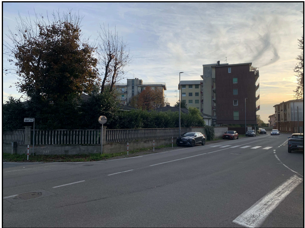
IMMAGINI DA VIA GRIGNA