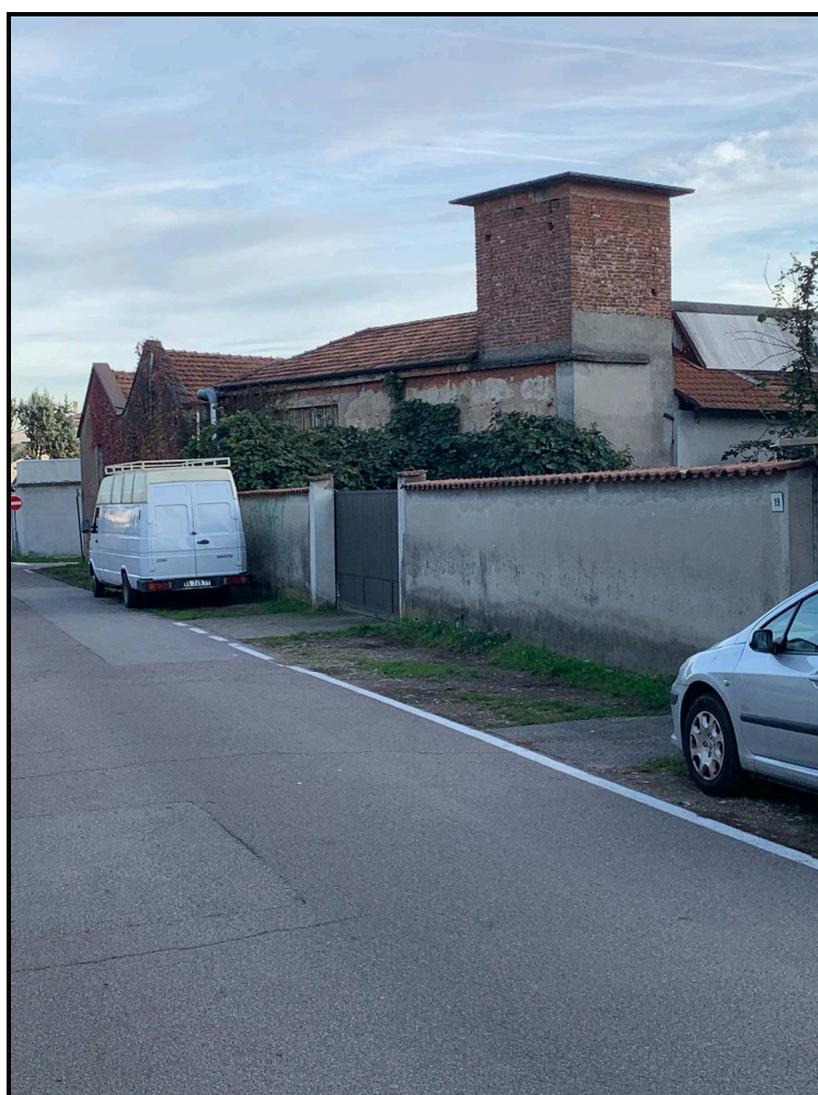
IMMAGINI DA VIA MONTE ROSA